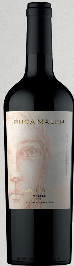
RUCA MALEN CAPÍTULO UNO