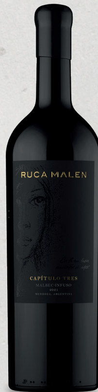
CAPÍTULO TRES Malbec Infuso 2021