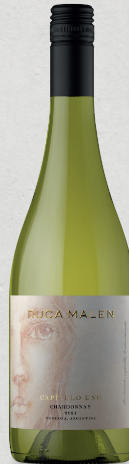
CAPÍTULO UNO Chardonnay 2021