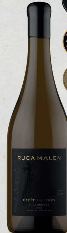
CAPÍTULO TRES Chardonnay 2021