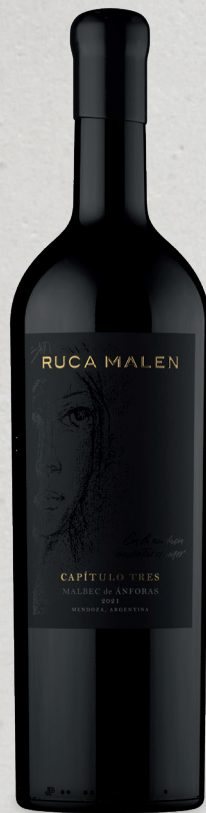
CAPÍTULO TRES Malbec de Ánforas 2021