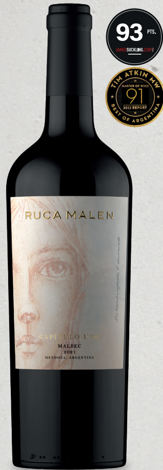
CAPÍTULO UNO Malbec 2021