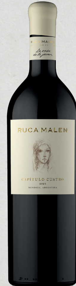
RUCA MALEN CAPÍTULO CUATRO