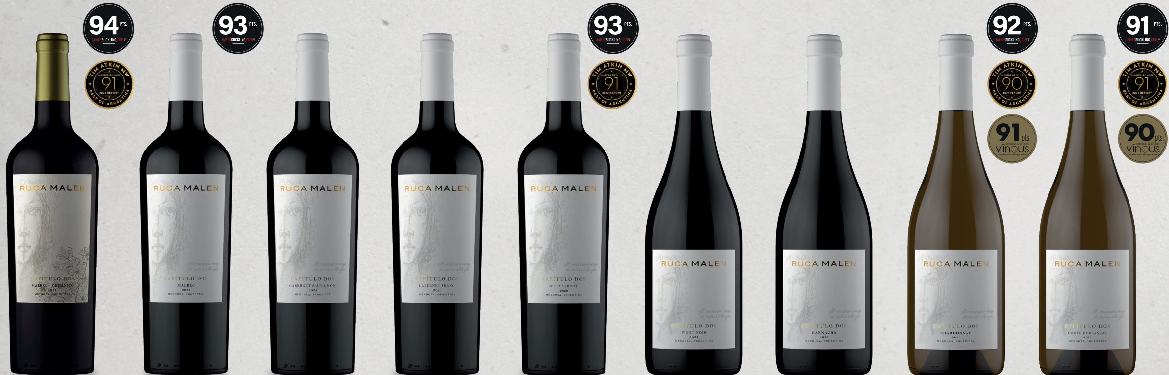
CAPÍTULO DOS Malbec Orgánico 2021