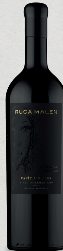
CAPÍTULO TRES Tinto Cofermentado 2021