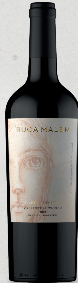
CAPÍTULO UNO Cabernet Sauvignon 2021