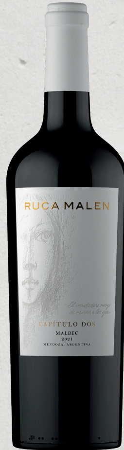
RUCA MALEN CAPÍTULO DOS